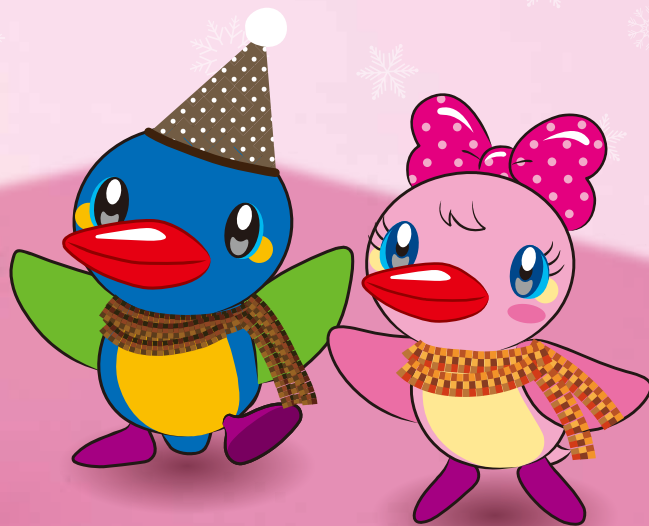
カワセミのムーちゃんとサツちゃん