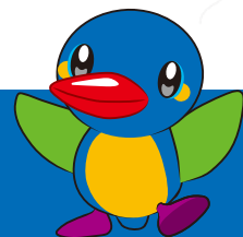
カワセミのムーちゃん