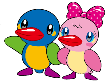
カワセミの ムーちゃんとサッチャン