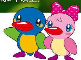
カワセミのムーちゃんとサッチちゃん